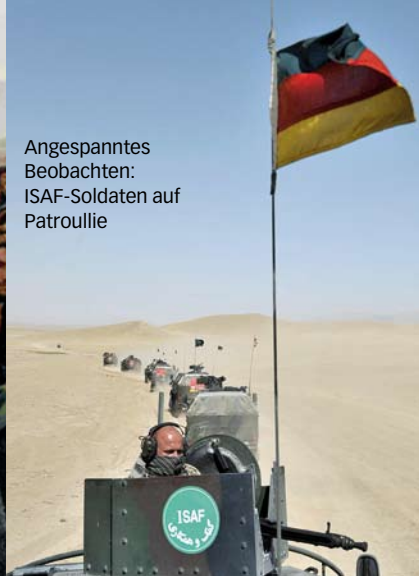
Angespanntes Beobachten: ISAF-Soldaten auf Patrouille

→ gibt kaum ein Buch, in dem so viel Blut vergossen wird. Aber es geht den biblischen Autoren nicht nur um die Frage, ob man töten darf. Es geht um mehr. Es geht um die Frage, wie man Töten und zwischenmenschliche Gewalt im Lauf der Geschichte ganz aus der Welt schaffen kann.