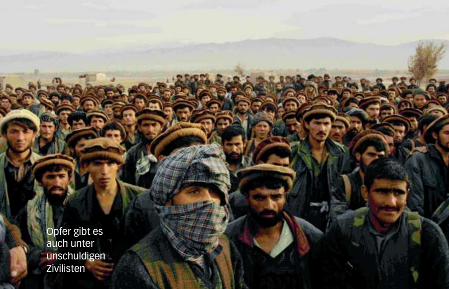
Opfer gibt es auch unter unschuldigen Zivilisten